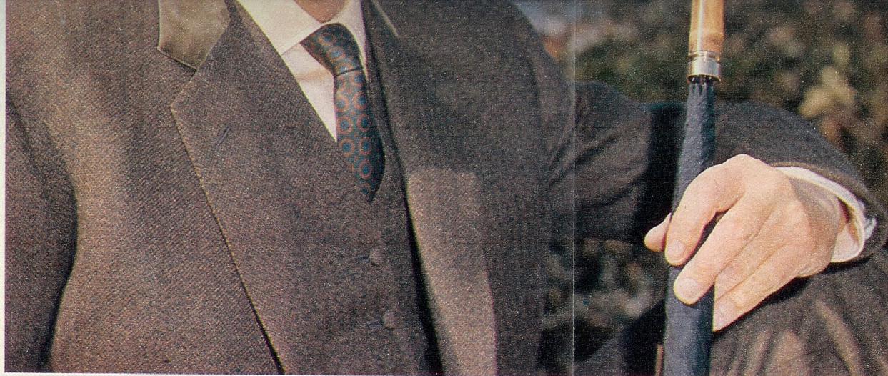
De centrale man door de jaren heen: John Steed

Ook dit seizoen komen De Wrekers weer terug op het KRO-tv-scherm. John Steed, Purdey en Gambit trokken in het afgelopen jaar gemiddeld 5.480.000 kijkers per keer in Nederland. De eerste aflevering van de nieuwe serie is donderdag 29 september, 20.25 uur, Ned. 2, en daarna zijn De Wrekers te zien iedere maandagavond, de nieuwe vaste tv-avond van de KRO. Op dit moment worden er in Canada nieuwe Wrekers -avonturen gefilmd; Studio ging er kijken en de resultaten daarvan laten we u in de komende maanden zien. Maar eerst een terugblikje op De Wrekers , van 1960 tot 1977.