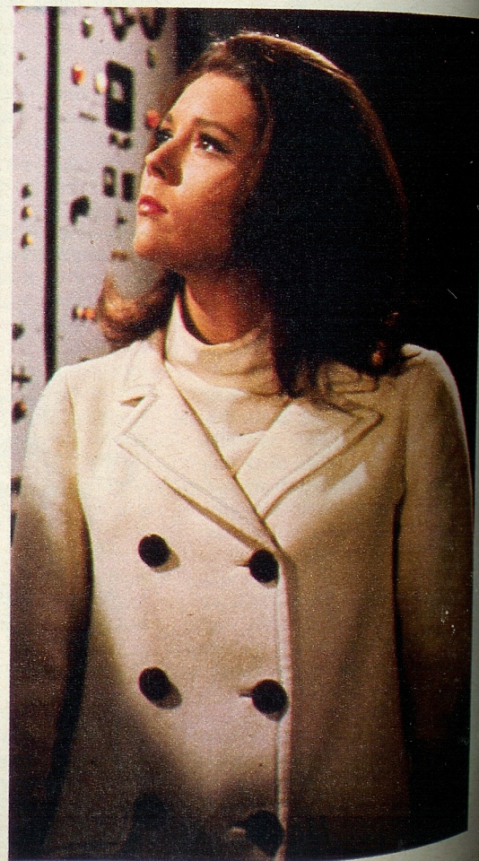
De tweede Wreekster: Diana Rigg

wee. „ De Wrekers ”-plannen worden gerealiseerd dankzij Franse geldschietters. Er werden dit keer twee assistenten van Steed ingevoerd: Gareth Hunt (o.m. oud-formule-1-racer) als Gambit en Joanna Lumley als de mooie vrijgevochten Purdey. Zij werd, na fotomodel te zijn geweest en kleine rollen in o.a. Coronation Street en „ Wordt u al geholpen? ” te hebben gespeeld, gekozen uit 300 kandidaten.