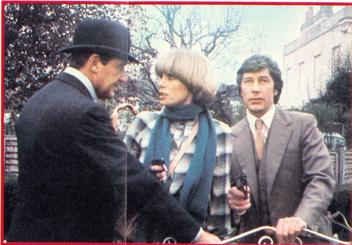
Het huidige team: Steed (Patrick MacNee), Purdey (Joanna Lumley) en Gambit (Gareth Hunt).

Wel, deze nieuwe Wrekers ziet u vanaf donderdag weer op het scherm. In de eerste aflevering wil een Chinese drug-koning het drietal in de val lokken en doden. Na veel spanning redden Steed, Purdey en Gambit het natuurlijk, maar het is, zoals altijd, op het nippertje. ●