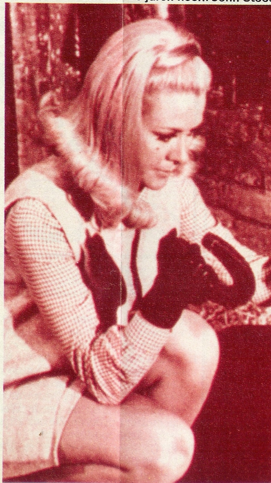
De eerste Wreekster: Honor Blackman

Het begon allemaal in 1960. Patrick MacNee kwam toen, na een paar jaar akteren en bordewassen in Amerika, terug in Engeland. Producer Sydney Newman, bezig met de voorbereiding van „ De Wrekers ”, vond dat hij de man was voor deze tv-serie. En MacNee zei ja, op voorwaarde dat hij geen snor hoefde te laten staan, zoals het draaiboek voorschreef. Zijn medespeelster werd, van 1960 tot 1963, Honor Blackman, als de blonde Cathy Gale, vaak gekleed in laarzen en zwartleren kostuum. Na drie jaar Wrekers nam zij een rol aan in de James Bond-film „ Goldfinger ” en is nóg regelmatig in films te zien.